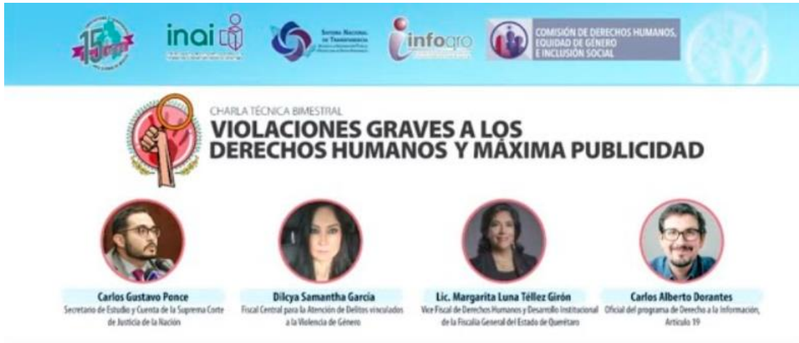
Charla técnica bimestral “Violaciones graves a los Derechos Humanos y máxima publicidad.”