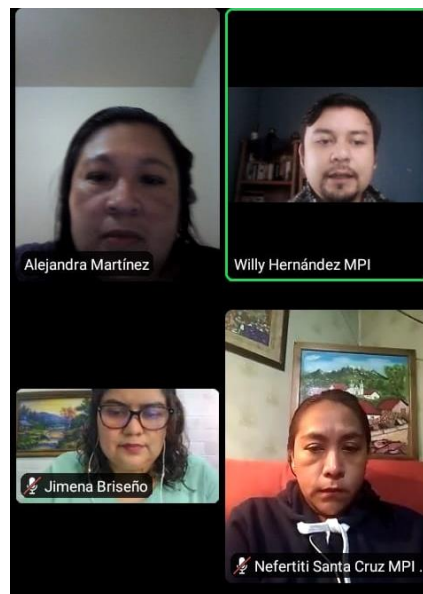
Segunda Sesión Ordinaria del Comité de Transparencia