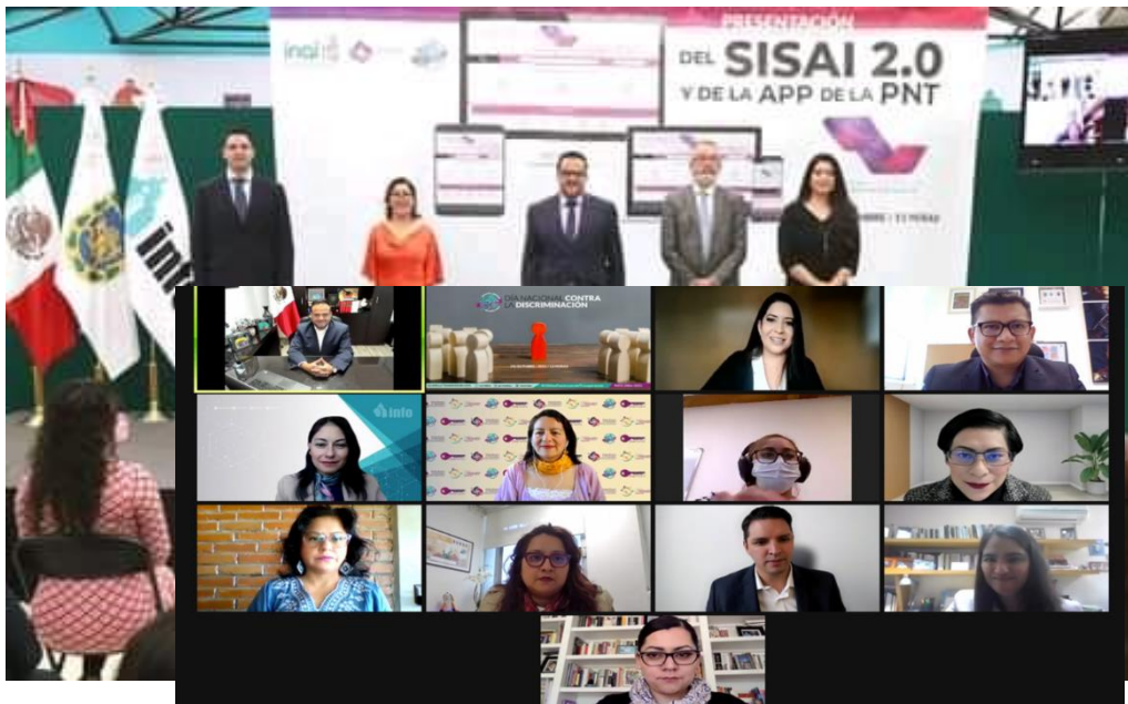
Presentación de SISA 2.0