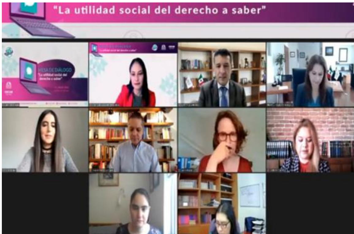
Mesa de Dialogo. “La utilidad social del derecho a saber”