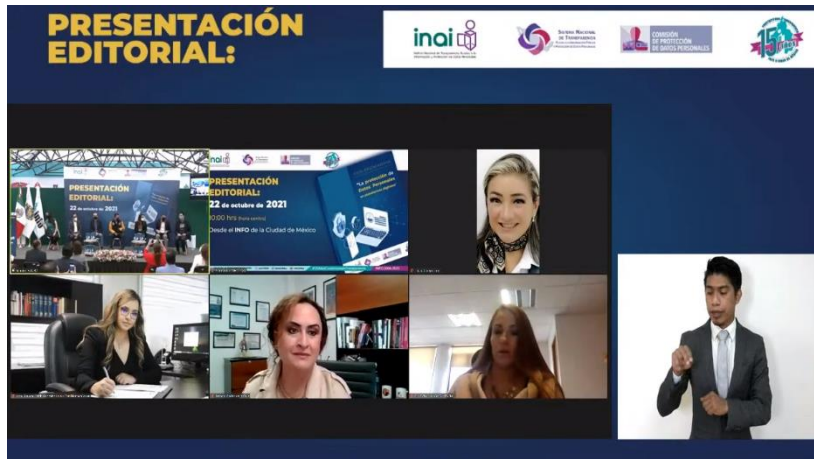
Presentación de la guía orientadora “La protección de datos personales en plataformas digitales”