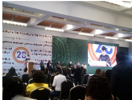
Foro Regional Centro. INMUJERES