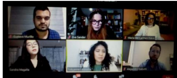
Clausura 10ª Edición, Diplomado de Transparencia