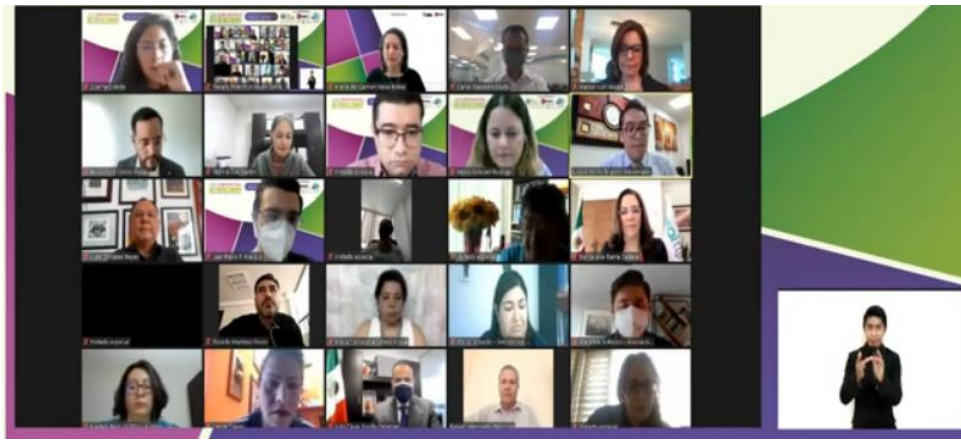
Presentación de la entrega de resultados del Primer Plan de Estado Abierto en la Ciudad de México (2019-2021).