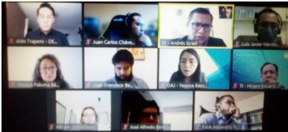
Reunión, Reactivación de Términos