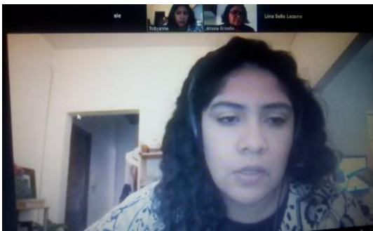
Reunión interna, Programa Anual de Capacitación