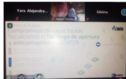
Decálogo de Apertura