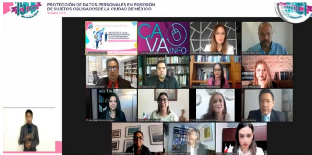
Presentación Curso Protección de Datos Personales