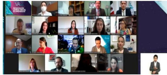
Sesión Solemne 15 Aniversario INFO CDMX Presentación del Campus Virtual CAVA INFO