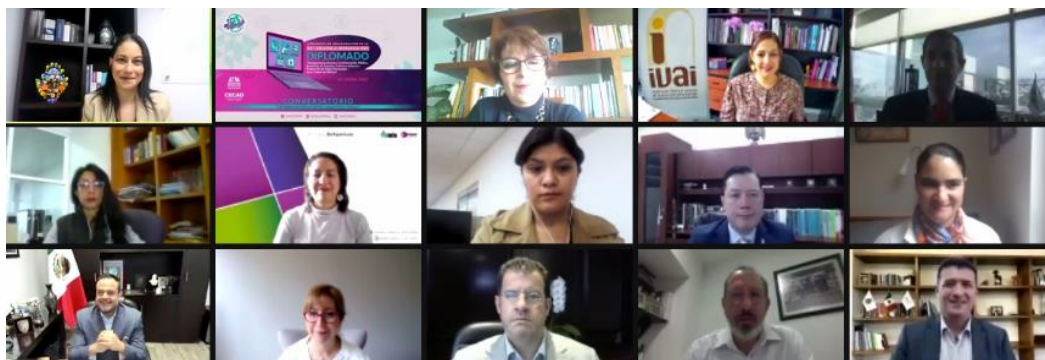
Presentación de la 11ª edición del Diplomado “Transparencia, Acceso a la Información Pública, Rendición de Cuentas, Gobierno Abierto y Protección de Datos Personales en la Ciudad de México”