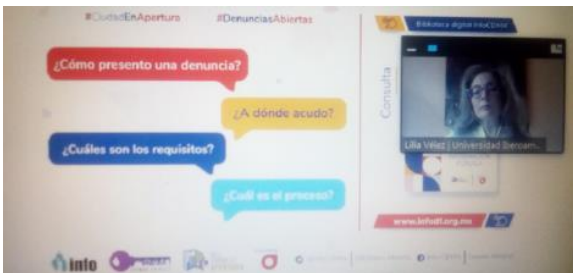
ABC Denuncias, vacíos de información