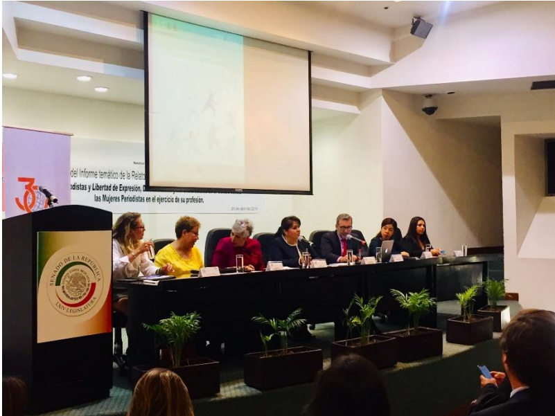
Presentación del informe temático: mujeres periodistas y libertad de expresión.