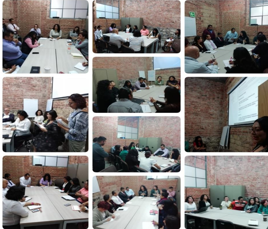
Reuniones semanales del equipo del MPI-CDMX