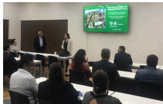
Reunión “Registro Nacional de Emisiones (RENE) 2019”