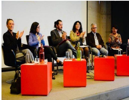
Foro “Personas Migrantes y Diversidad Sexual”