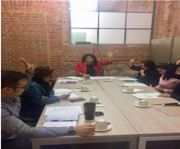
Primera sesión del Comité de transparencia.