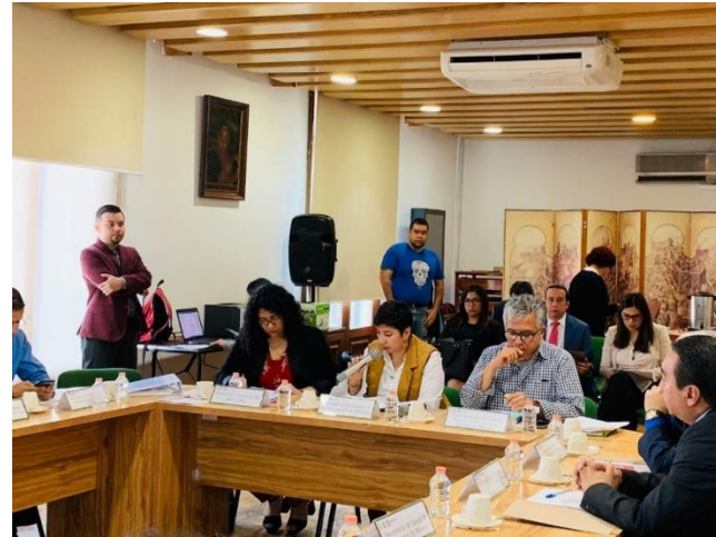
Primera Sesión Ordinaria Junta de Gobierno del día 22 de marzo de 2019.