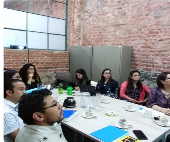
Reunión de seguimiento con PROVOCES