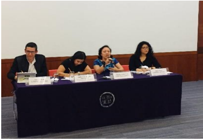
Foro “El papel histórico de la radio en la sociedad mexicana”