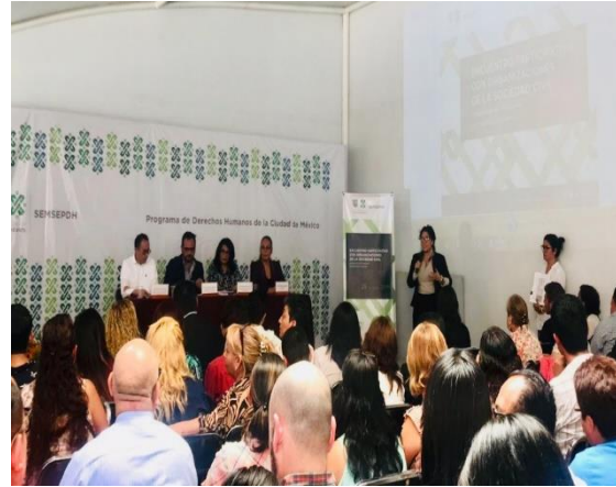
“Foro en materia de Derechos Humanos, Migración y Población”