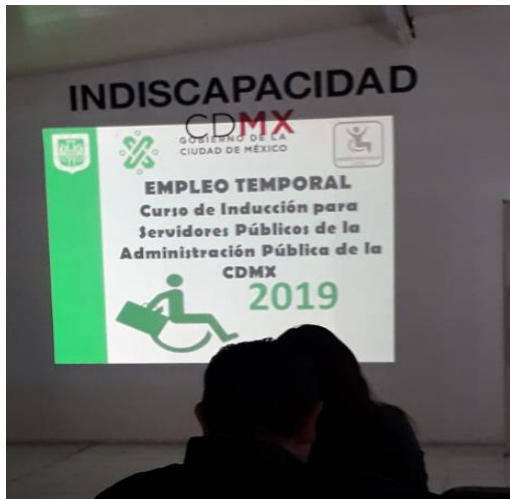
“Curso de Inducción para Servidores Públicos de la Administración Pública de la CDMX 2019”