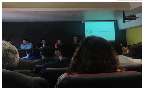
Reunión en la Secretaría de Administración y Finanzas de la Ciudad de México, en la que se trató el tema “Presupuesto 2019”