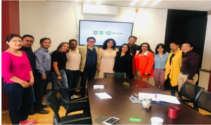
Presentación del MPI CDMX en la Alcaldía Magdalena Contreras