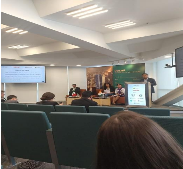
Presentación del Índice Estatal de Libertad de Expresión en México 2019